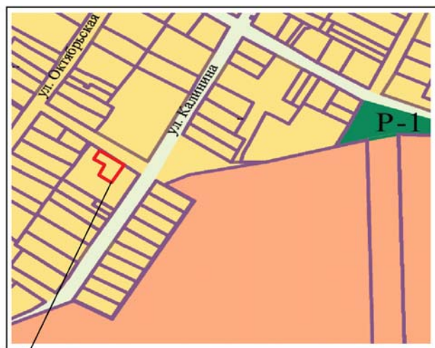
Схема градостроительного зонирования с картой зон с особыми условиями использования территории

Земельный участок с кадастровым номером 23:08:0102185:381